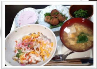
チラシ寿司ランチ