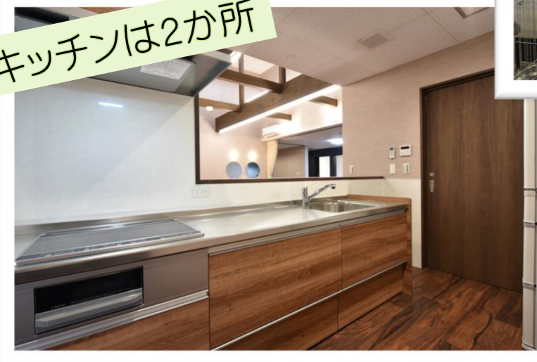
毎日家庭的な食事を提供しています 調理ができる方は一緒に作っていただきます