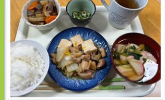
昼食メニュー(例) すき焼き風煮・筑前煮 オクラ和え物・お吸い物