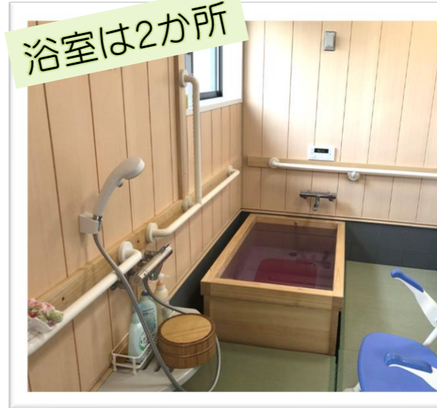
ひのき風呂に床はタタミ敷きで温まります もう1か所は車いす対応のチェアー浴・ストレッチャー浴