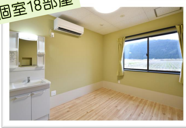
馴染みの家具など持ち込めます (介護ベッドは備え付け)