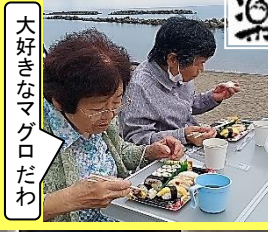
大好きなマグロだわ