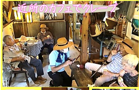
近所のカフェでクレーブ