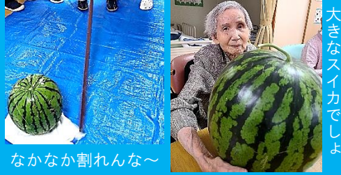
大きなスイカでしょ