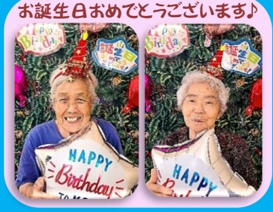
お誕生日おめでとうございます!