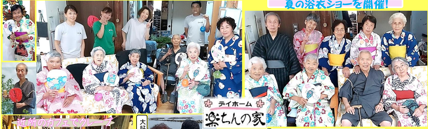
＊ テイホーム ＊ 楽ちんの家