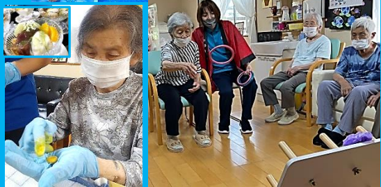
美味しいおやつ作り よいしょ! それ入れ! なかなか割れんな~