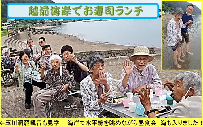
越前海岸でお寿司ランチ