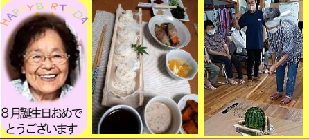
HAPPY BIRTHDAY 8月誕生日おめで とうございます